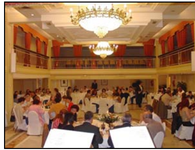
Edició del Samaruc del passat any.

A hores d'ara el jurat dels premis Samaruc ja ha encetat la lectura de les obres que concorren a l'edició d'enguany. La data del sopar de lliurament dels premis serà el divendres dia 2 de juny i el lloc s'anunciarà en el seu moment.