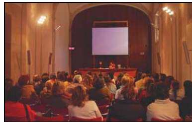
II Jornades Bibliotecàries.